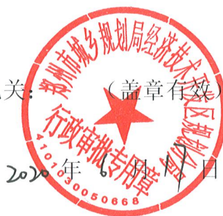
核准规划建设用地表