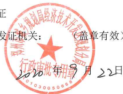
核准规划建设用地表